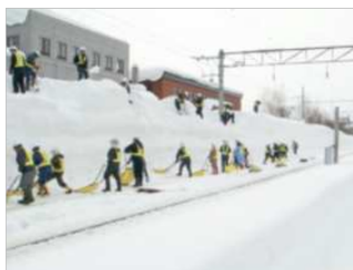
駅構内の人力除雪