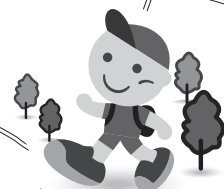
JRヘルシーウォーキング イメージキャラクター「歩くん」