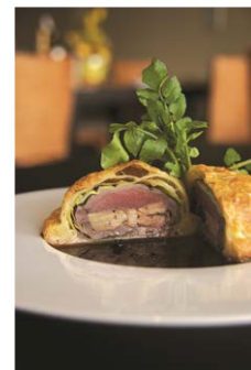
メニュー一例(鹿パイ)