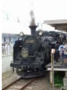
昨年の SL 夕張応援号

昨年同様、新夕張駅での出発式、地元でのイベント、お得なきっぷの設定、SL を利用した旅行商品の設定などを予定しております。詳細につきましては、決定後お知らせ致します。