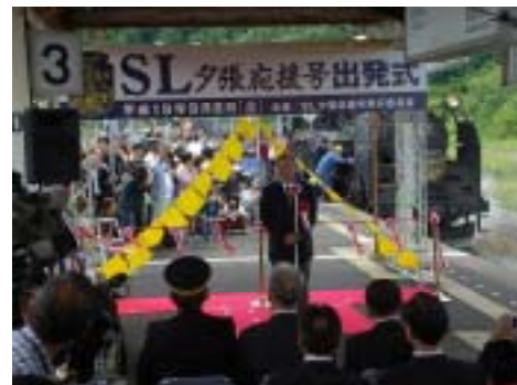
昨年の新夕張駅出発式の様子