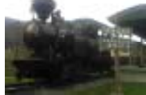
< 丸瀬布いこいの森 >

自然環境を活かした緑がたっぷりの公園。園内には、北海道遺産に登録された森林鉄道 SL 雨宮 21 号・郷土資料館・キャンプ場などがあり、すぐそばには温泉、昆虫生態館があります。