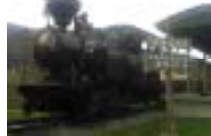
< 丸瀬布いこいの森 >

自然環境を活かした緑がいっぱいの公園。園内には、北海道遺産に登録された森林鉄道 SL 雨宮 21 号・郷土資料館・キャンプ場などがあり、すぐそばには温泉、昆虫生態館があります。