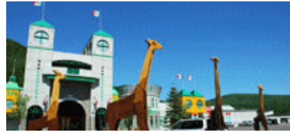
< ちゃちゃワールド >

高さ 78m、北海道自然百選にも指定されている町のシンボル。瞰望岩(がんばういわ)の頂上にある展望台。