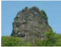
< 瞰望岩展望台 >

高さ 78m、北海道自然百選にも指定されている町のシンボル。瞰望岩(がんばういわ)の頂上にある展望台。