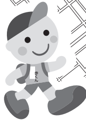
JRヘルシーウォーキング イメージキャラクター「歩(あゆむ)くん」