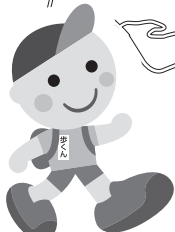
JRヘルシーウォーキング = イメージキャラクター「歩(あゆむ)くん」