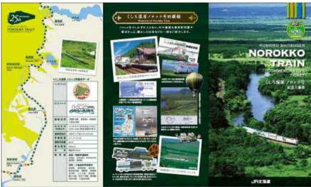
(記念入場券台紙 表面)