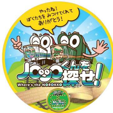
(かくれノロッコくん)