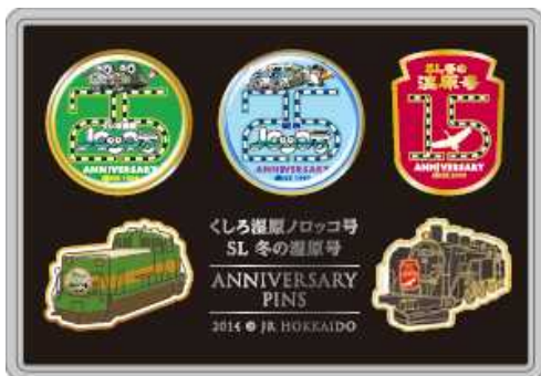
(3列車周年記念ピンズセット) 1セット：2,000円

ノロッコ号25周年を全面に出したピンズセット(限定1,000セット)と、25周年記念ラベルをあしらったノロッコ号プリンを車内限定発売!