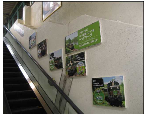
(釧路駅3番ホームエスカレーターパネル)