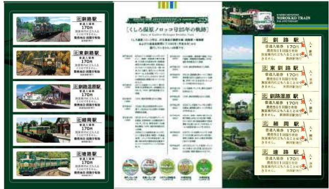
(記念入場券台紙 中面)