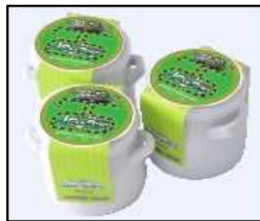
(25周年記念ラベルノロッコ号プリン) 1個：370円