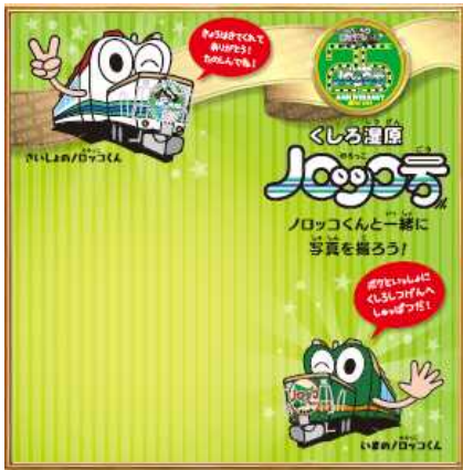
(3番ホーム中央記念撮影パネル)