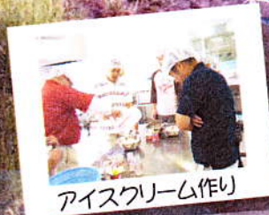
アイスクリーム作り