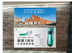
②洋物館タペストリー