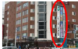
①アネックス壁面懸垂幕