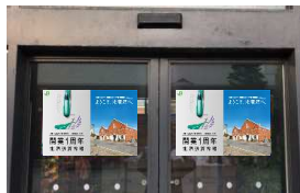
①各施設入口シール