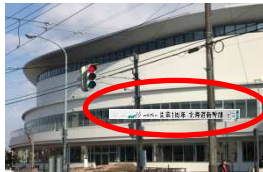
①路面電車側 2階横断幕