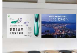
①山頂駅売店通路シート