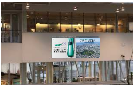
①五島軒窓下シート