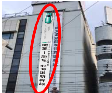
①路面電車側懸垂幕