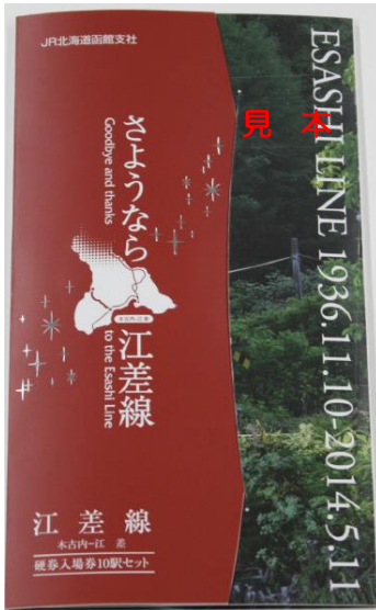
【記念台紙表面】（イメージ）

木古内～江差間全 10 駅のイラスト入り記念入場券を 10 枚 1 組セットでご用意させていただきました。