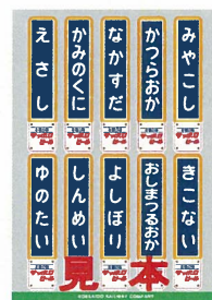
木古内～江差間 ミニ駅名標ステッカー （イメージ）