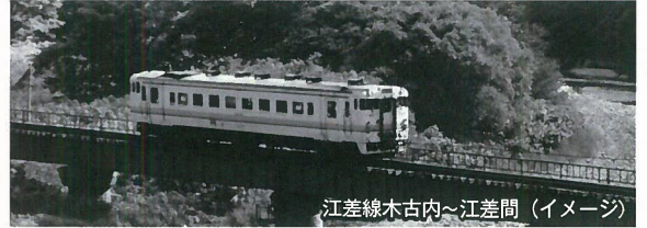
江差線木古内～江差間(イメージ)

JR江差線 木古内～江差間は、1936年(昭和11年)に湯ノ岱～江差間が開業し全線が開通しました。以来約80年の長きにわたり、たくさんのお客様にご利用いただきましたが、平成26年5月12日(営業運転は5月11日まで)をもちまして廃止させていただきますこととなりました。 JR北海道函館支社では平成25年4月より「ありがとう江差線企画」を実施しており、その第8弾として、バスで江差線 木古内～江差間の全駅をめぐり、江差到着後は江差観光をお楽しみいただいたあと、廃止される江差～木古内間の列車の旅をお楽しみいただけるツアーを企画致しました。 ぜひこの機会に、江差線の旅をお楽しみください。