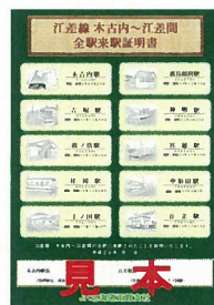
木古内～江差間 全駅来駅証明書 （イメージ）