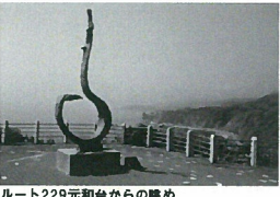
ルート229元台からの眺め

江差の北側に位置する乙部町。海拔40mの高さに位置し、紺碧の日本海を一望できる道の駅と、自然湧水を、北海道南西沖地産を教訓に災害時の貴重な給水施設として整備した「といの水」へご案内します。