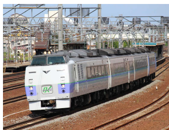
初期型 (現在の塗色)