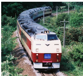
初期型 (登場時の塗色)

現在も特急「オホーツク」、「大雪」などで使用していますが、1980 年代前半に登場した初期型の車両 (キハ 183-0 系) は新型車両の投入などにより順次引退しており、キハ 183-0 系のみ 5 両で運転している旭山動物園号は 3 月 25 日のラストランで、最後まで残る中間車のキロハ 182 なども 6 月までに引退となる予定です。