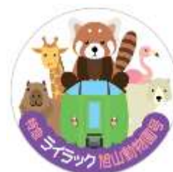
オリジナル缶バッジ