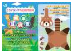
ペーパークラフト（旭川→札幌）