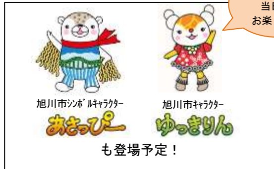
<b. 旭川観光物産情報センター 顔はめパネル>