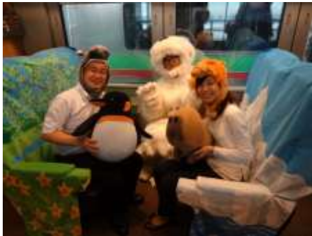
<a. ライラック旭山動物園号>