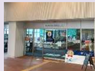
旭川観光物産情報センター