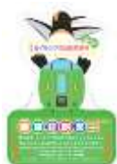
ステッカー（札幌→旭川）