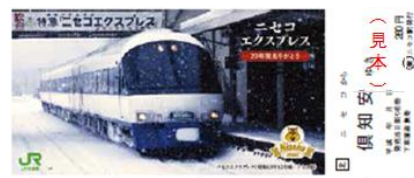
(下り ニセコ→倶知安間)