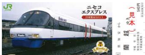
(上り 倶知安→蘭越間)