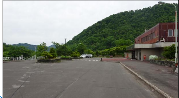
現駅前広場と駅舎 (右)