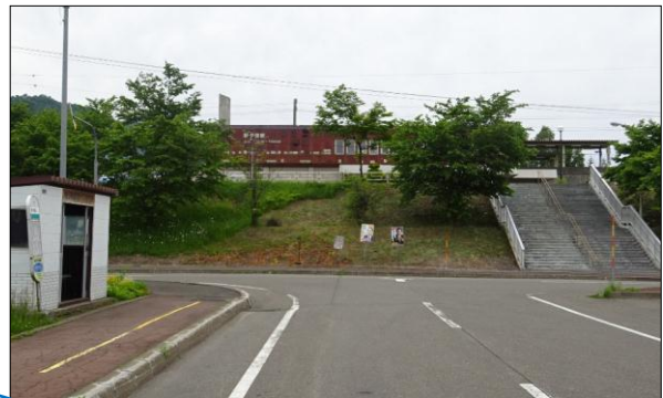
現バス乗り場 (左) と駅舎 (中央奥)