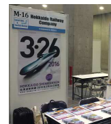
昨年の商談会ブース