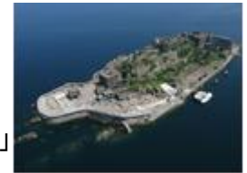
(※写真はイメージです。)