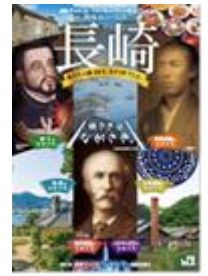
(※ガイドブック表紙)

各エリアの観光情報やキャンペーン期間中に開催される長崎DC特別企画、イベント情報などを掲載した長崎DCガイドブック約40万部を全国のJR主要駅や旅行会社窓口等において配布します。