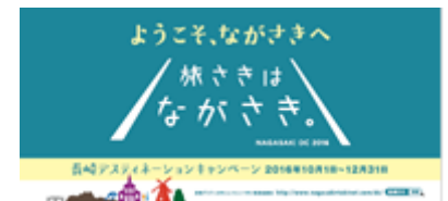
(※おもてなしステッカー)