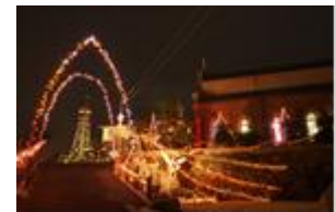
(※写真はイメージです。)

このコンサートに、一日先着10名様(ペア5組※先着順)を長崎DC特別席としてご用意します。