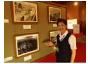
(※写真はイメージです。)