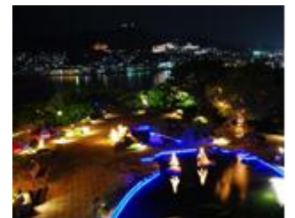
(※写真はイメージです。)

長崎DC期間中の10月22日（土）、10月29日（土）の2日間、ライトアップされた「グラバー園」において、「変面ショー」、「ハウステンボス歌劇団」、「二胡」や「バグパイプ」などによるイベントを実施します。ライトアップされたグラバー園から長崎の夜景を楽しみながら、長崎ならではのショーをお楽しみ下さい。