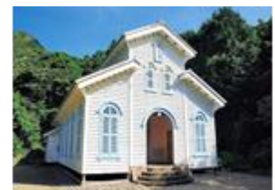
(※写真 左：使用する海上タクシー、右：江上天主堂)