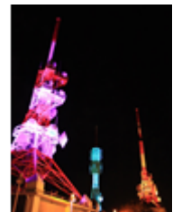
(※写真はイメージです。)

ハウステンボス長崎DC特別企画として、パレスハウステンボスでのジュエルイルミネーションショー特別観覧席（毎日5~7回実施 ※各回先着1組2名様）をご用意しました。光と音楽が奏でる壮大なショーを堪能してください。