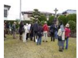
(※写真はイメージです。)

(実施日は、10月9日(日)、10月23日(日)、11月13日(日)、12月11日(日)のみ)