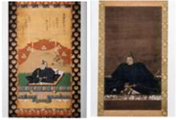
(※写真 左：徳川家康公、右：宗義智公)

徳川家康公と対馬藩初代藩主宗義智（そう よしとし）公の二人の肖像画を、対馬歴史民俗史料館で長崎DC期間中特別公開します（通常非公開）。朝鮮との外交窓口であった対馬藩と徳川幕府との繋がりを垣間見ることができる、ストーリー性を重視した特別企画展です。