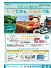
おトクにめぐる、北海道の旅

なお、こちらのパンフレットは、部数限定で会員様にお配りする他、JR北海道及びJR東日本の大人の休日倶楽部のホームページにて掲載いたします。