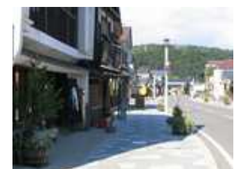
江差いにしえ街道

※ 詳しくは専用パンフレット又は「旬感千年北海道」ホームページをご参照ください。