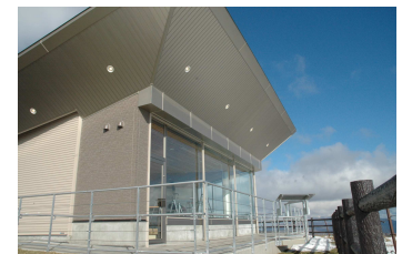
きじひき高原・屋内展望施設