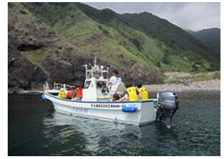
矢越海岸クルージング