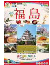
専用商品パンフレット（イメージ）