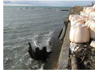
写真① 鋼矢板変形状況