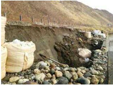
写真③ 盛土流出状況