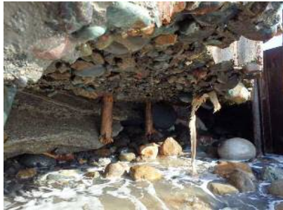
写真② 根固コンクリート下部洗掘状況