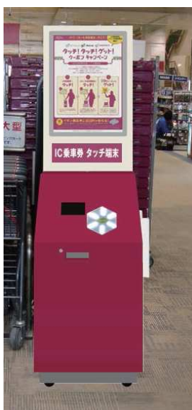
イオン札幌桑園店設置の端末機