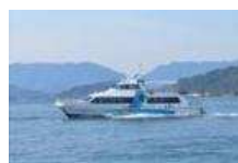
(広島湾宝しまクルーズ)

広島県内にある「瀬戸内の島々」、「観光地」などをスムーズに巡り、多くの「芸術」、「伝統」、「食」などを体感できるよう、広島DC期間中には「広島湾宝しまクルーズ」「呉・御手洗宝しまクルーズ」「広島市内観光ループバス ひろしま めいぷる一歩」など、2次アクセスを多数ご用意しております。