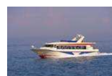
(呉・御手洗宝しまクルーズ)