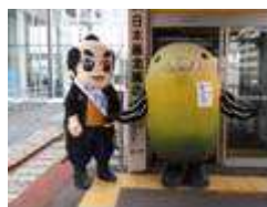
だしのすけ りんぞうくん&出汁之介