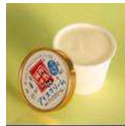
稚内牛乳 アイスクリーム(宗谷産塩味) 250円