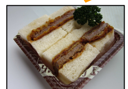
稚内全日空ホテル 宗谷黒牛サンドウィッチ 800円