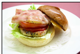
グランドホテル藤花 なよろバーガー 500円