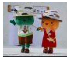
びふか みみ 美深くん&美深ちゃん

※写真・イラストはイメージです。また、イベントや特産品は予告なく内容が変更となることがあります。