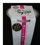
川島旅館 湯あがり温泉プリン (さっぱりタイプ) 250円