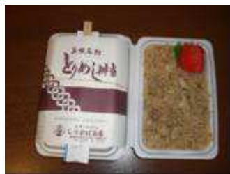
しらかば茶屋 とりめし 550円