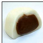
もち米の里ふうれん特産館 ソフト大福(白) 140円