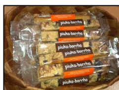
菓子司すぎむら ピウカ・ポッチャ 180円