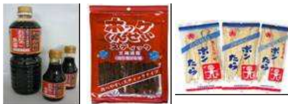
（特産品の一例 変更となる場合がございます）