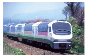
(ノースレインボー車両)