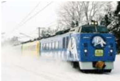
変更前の車両（旭山動物園号車両）