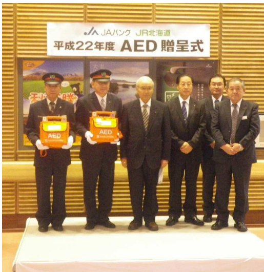
▲(参考)昨年度、旭川駅でのAED贈呈式の様子