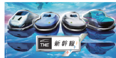
「THE 新幹線」オリジナルピンバッジ(イメージ)