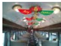
～ S L 車内イメージ～