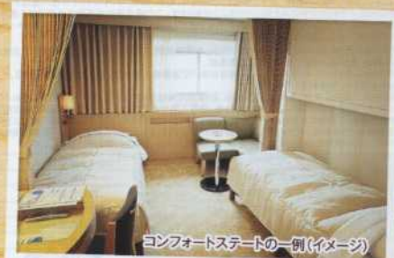
コンフォートステートの一例(イメージ)