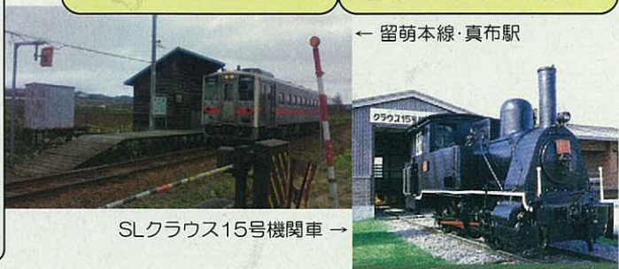
SLクラウス15号機関車 →

そこでこの留萌本線の中でも1日数本発着の旅人を待つ小さな無人駅とその周辺の散歩へ出かけてみませんか? 意外な発見があるかもしれません。