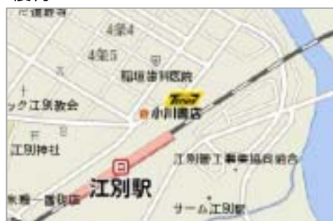
タイムズ江別駅前 地図