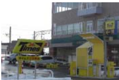
タイムズ江別駅前

住 所 : 北海道江別市2条5 収容台数 : 69台 営業時間 : 24時間 駐車料金 : 終日60分 100円(駐車後24時間まで最大料金600円) 優待料金 : 駐車料金から200円差し引いた料金にご優待