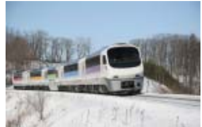
ノースレインボー車両