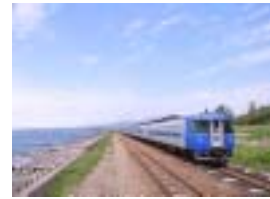
今回は「撮り鉄」も楽しめます!