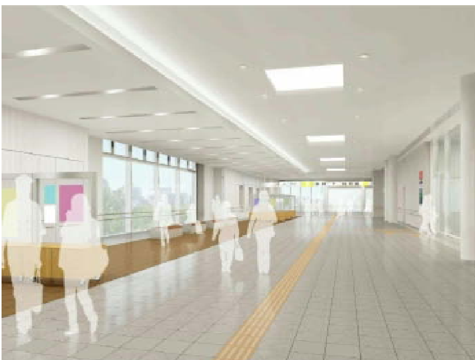
《参考》 自由通路内観