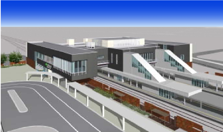
橋上駅舎 自由通路 外観（南側）