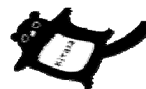
記念カードデザイン