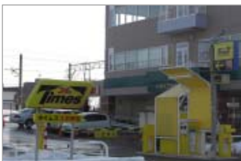
タイムズ江別駅前