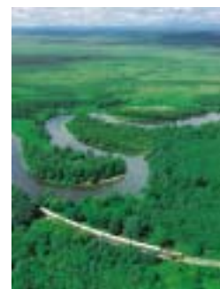
釧路湿原の中を走る 「くしろ湿原ノロッコ号」