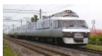
フラノラベンダーエクスプレス