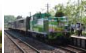
富良野・美瑛ノロッコ号