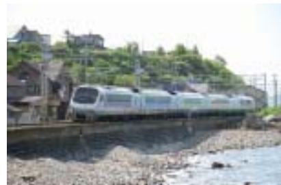
「さくらエクスプレス」に使用するノースレインボー車両