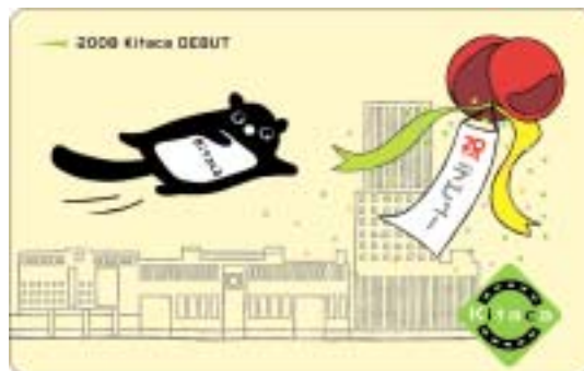
記念カードデザイン