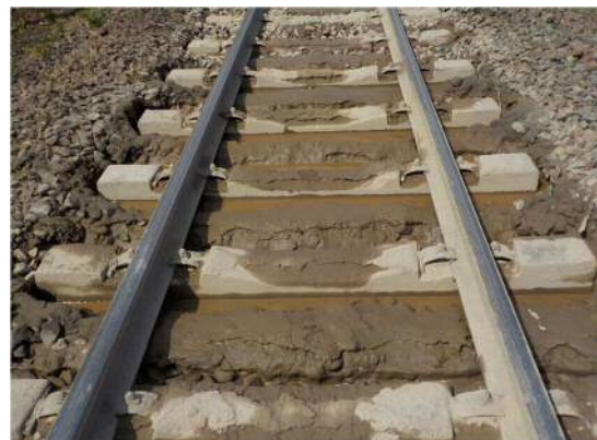
② 渡島砂原駅～掛洞駅