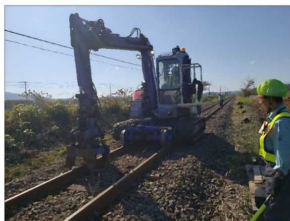
写真2. 重機による道床つき固め作業