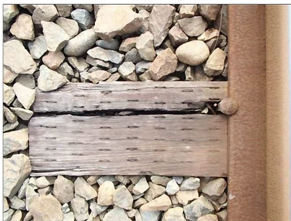
写真3. 割れたマクラギの例（施工前）