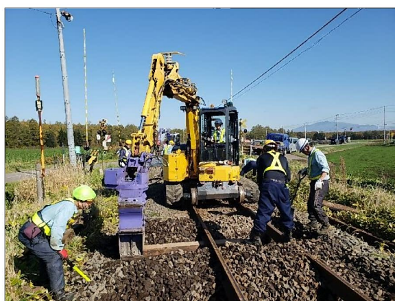
写真1. 重機によるマクラギ交換作業