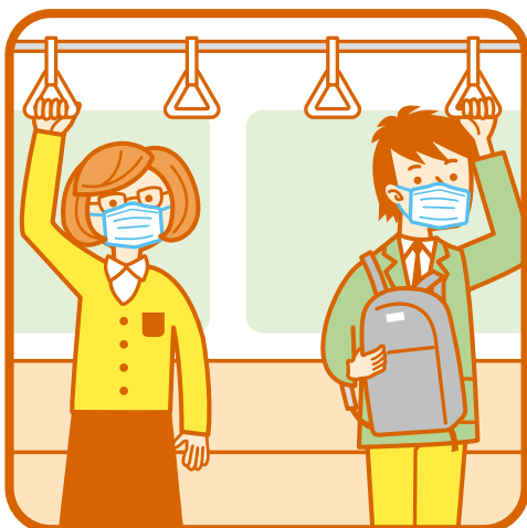
マスクの常時着用

車内や駅構内ではマスクを着用し、会話は控えめにお願いします。 あわせて、手洗い・咳エチケット、黙食へのご協力をお願いいたします。