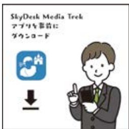
事先下載 SkyDesk Media Trek APP