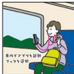
在車內打開 APP 選擇 Book