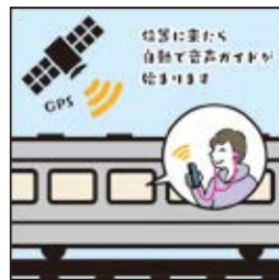
在接近設置的位置時， 語音導覽會自動開始播放。