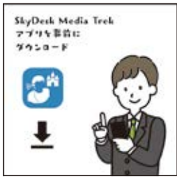
事先下載 SkyDesk Media Trek APP