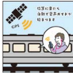
在接近設置的位置時，語音導覽會自動開始播放。