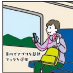
在車內打開 APP 選擇 Book