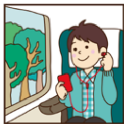
使用語音導覽服務時請務必戴上耳機。 ※若沒有耳機，請您盡量避免使用。