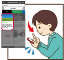
事先下載「kokosil®」APP。 在「kokosil」選擇「JR北海道沿線導遊」