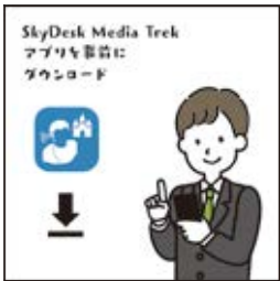
事先下载 SkyDesk Media Trek APP