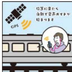
在接近设置的位置时， 语音导游会自动开始播放。