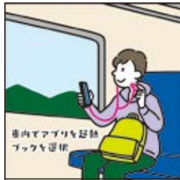
在车内打开 APP 选择 Book