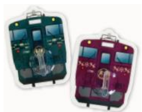
(原创好礼参考图片)