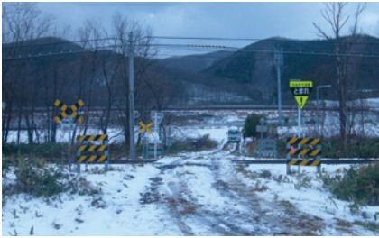
日中は反射材、夜間はLEDにより「ふみきり注意」と「まれ!」の文字が浮き上がって見え、そこに踏切があることが遠くからでもわかります。

次いで二番目です。北海道において、第四種踏切は全体の約八%に過ぎませんが、JR北海道では安全最優先の取り組みを隔々まで展開し、踏切事故防止を目指していきます。