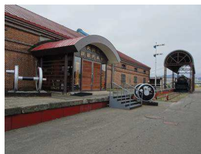
【北海道鉄道技術館】