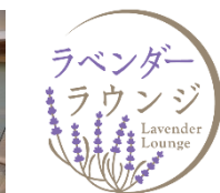
ラベンダーラウンジロゴ

「ラベンダーラウンジ」（フリースペース）イベント等で使用するスペースで、グループでも個人でもご利用頂けます。